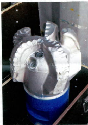
Специалисты компании предложили использовать пятилопастное долото с резами в диаметре 13 мм

Ну а «виновниками» столь знаменательного достижения можно без преувеличения назвать долота производства компании Буриинтех (УФА), которые еще раз напомнили нам знаменитое изречение: нефть – на конце долота. В нашем случае – успех обеспечила замена всего одной детали. Вместо шестилопастного долота специалисты компании предложили ис-